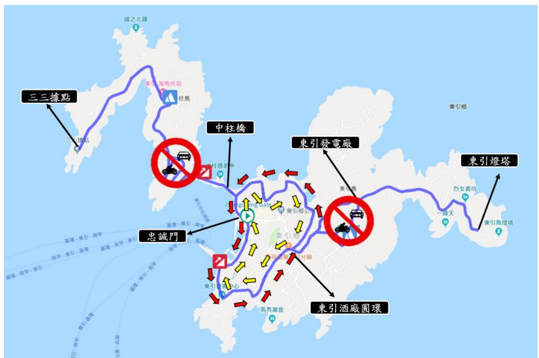
附圖一、活動範圍圖